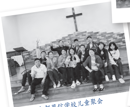
木邦恩信学校儿童聚会