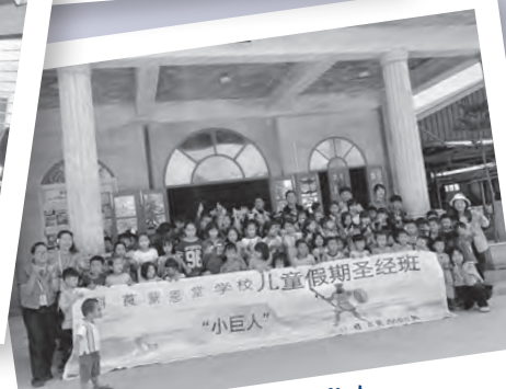
科崑蒙恩堂儿童聚会

学；如今开学了，可是少年人已经不想读书，都去打工了。详加追问之下，恍然得悉这些年轻人在缅甸边境诈骗集团操控的‘诈骗公司’打工！为什么？就因为那里支付的工钱很多。非常遗憾的是，在这些人当中不单有基督徒的孩子，还有传道人。儿童、青少年事工的推展，真是刻不容缓！