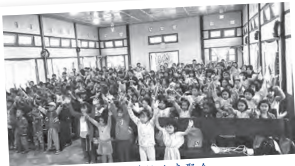
完培新光学校儿童聚会