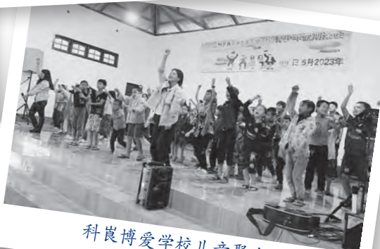
科崑博爱学校儿童聚会