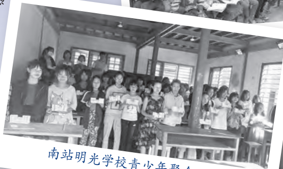
南站明光学校青少年聚会